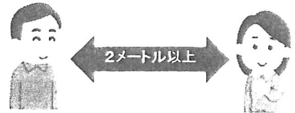
距離を保って、会話をする際はマスクは不要